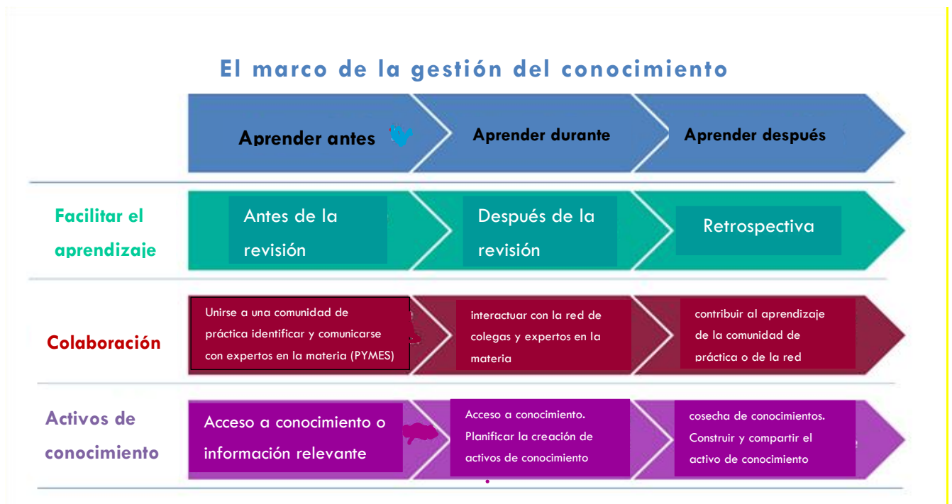
Fig3.3: El marco de gestión del conocimiento (fuente: https://doc.rero.ch/record/11265/files/eppler_JKM_2008.pdf )

nuestra recomendación contratar a un experto externo, al planificar un sistema de gestión detallado en la empresa.